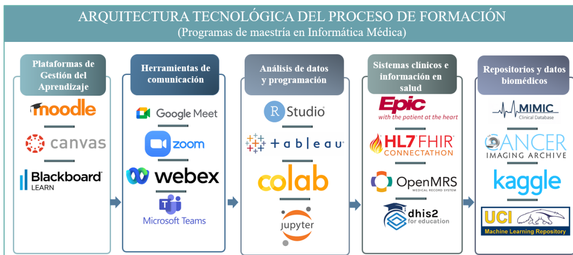
Fig. 3- Arquitectura tecnológica de los postgrados en Informática Médica en la modalidad de estudio a distancia.

El análisis detallado de los estudios primarios muestra que los programas de formación a distancia en informática médica utilizan un conjunto de tecnologías organizadas en varios niveles funcionales, que combinan herramientas educativas tradicionales con infraestructuras tecnológicas utilizadas en los sistemas de salud. A diferencia de otros programas académicos en línea, los programas de Informática Médica integran plataformas educativas, entornos de análisis de datos, sistemas clínicos reales y herramientas de interoperabilidad sanitaria, lo que permite reproducir en el entorno formativo las tecnologías utilizadas en los contextos profesionales de salud digital (Figura 3).