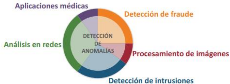
Figura 1. Representación de la detección de anomalía mediante sus campos de aplicaciones.

2005; Spence et al., 2001). Esta técnica permite el reconocimiento de patrones que no se comportan de la manera esperada en los datos (Kesavaraj and Sukumaran, 2013; Chandola et al., 2009). En una red informática, patrones de comportamiento inusual podrían significar que una computadora pirateada está enviando datos confidenciales a un destino no autorizado (Kumar, 2005). Diferentes comportamientos en los datos de transacciones con tarjetas de crédito podrían indicar el robo de identidad o de la tarjeta de crédito (Aleskerov et al., 1997). Las lecturas de comportamientos inusuales de un sensor de nave espacial podrían significar un error en algún componente de la nave (Fujimaki et al., 2005). Incluso al trabajar con imágenes médicas, un cambio abrupto en la intensidad de los píxeles en lugares inesperados, puede indicar la presencia de tumores malignos (Spence et al., 2001). Todos estos patrones que no siguen el funcionamiento esperado son conocidos como anomalías y su detección permite la prevención de nuevos ataques, malos funcionamientos, así como la detección a tiempo de tumores. En la Fig. 1 se muestran varios de los campos donde se realiza la detección de anomalías.